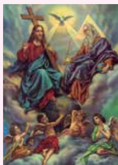
"Glorificami, Padre, davanti a te".